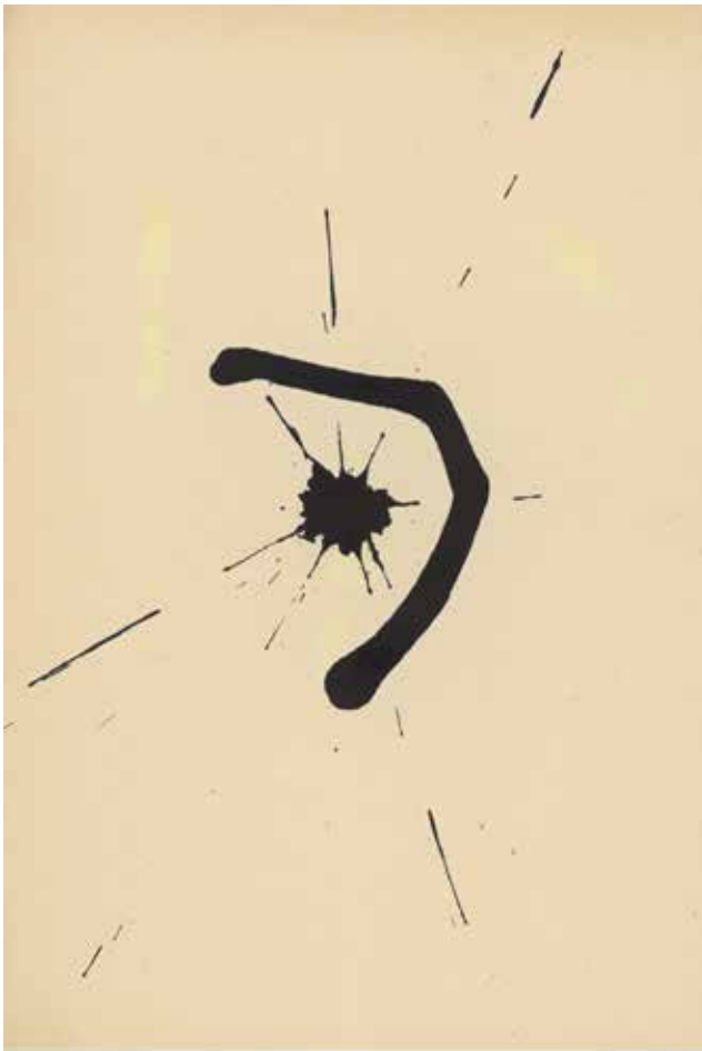
Disegno a china di György Kurtág, anni '70 (277 x 192 mm).